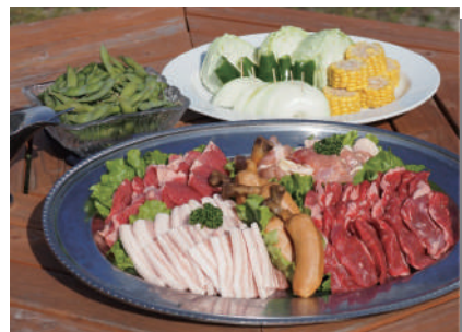
キャンププラン バーベキュー（5人前）